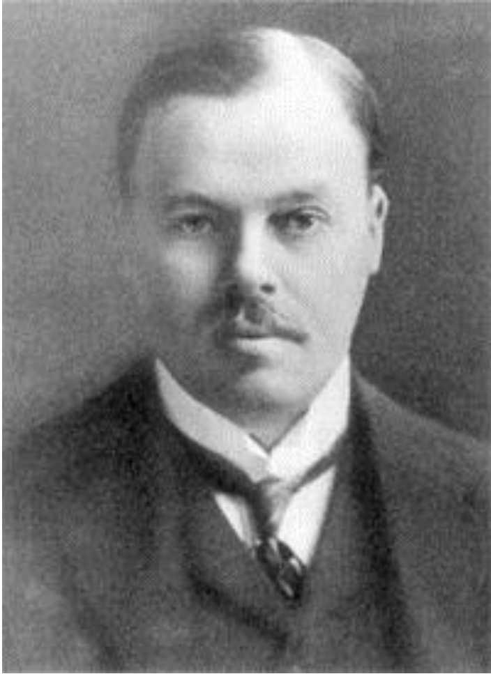
Lord Rothermere, angol sajtómágnás, 1927.