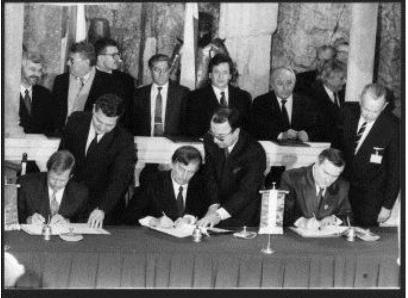
Visegrádi 3-akk találkozója 1991-ben, Lech Walesa, Antall József és Vaclav Havel