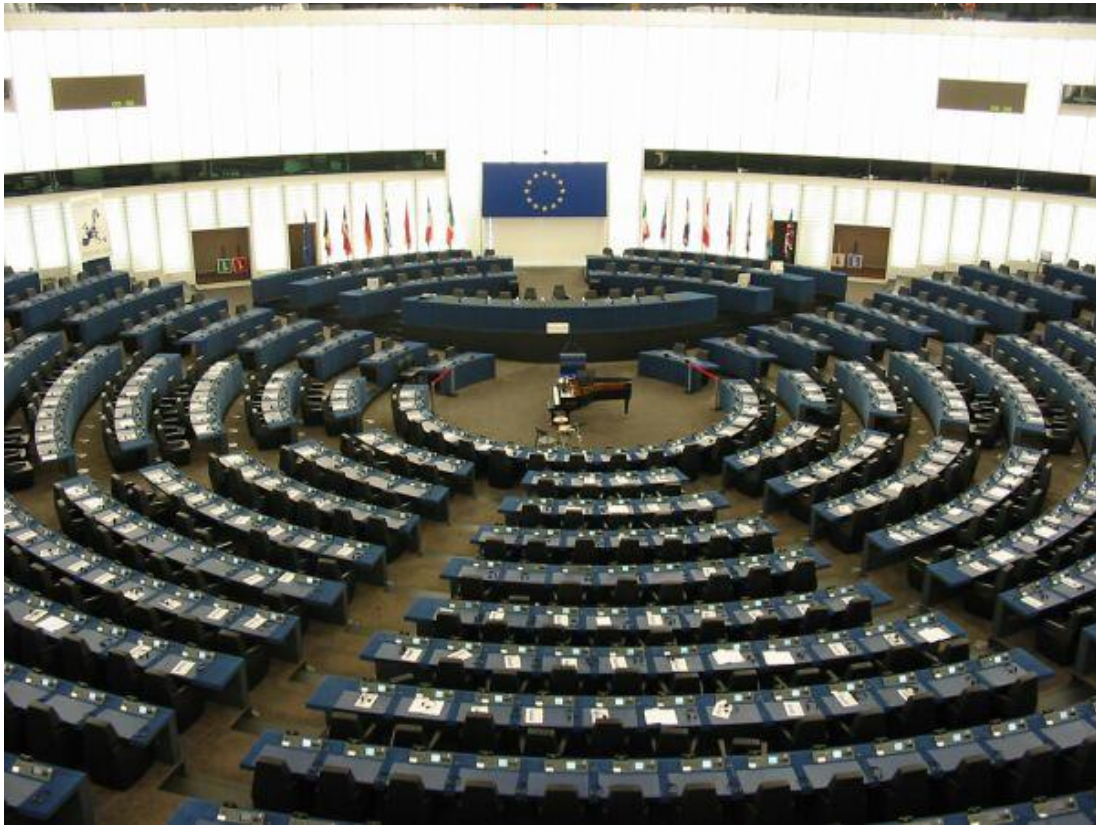
Európai Parlament, 2010