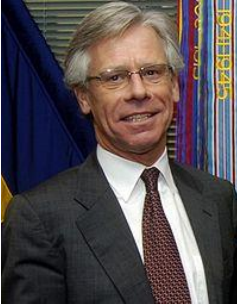
Knut Vollebaek, EBESZ Kisebbségügyi főbiztos, 2010.