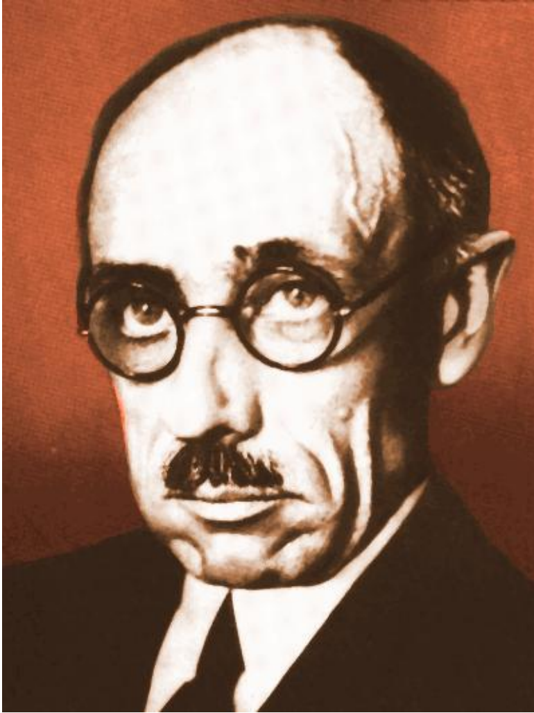
Teleki Pál, miniszterelnök, 1940