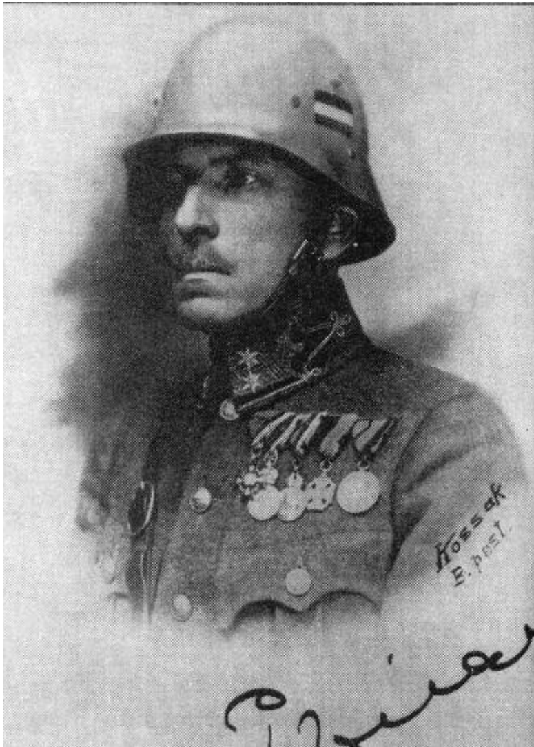
Prónay Pál, akinek Sopront köszönhetjük